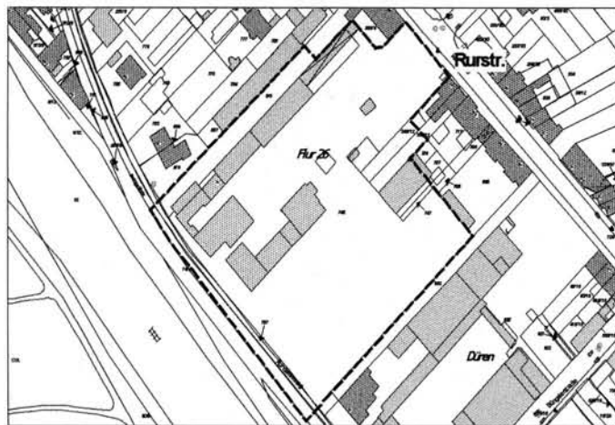
„Kreis Düren, DGK 5, Kontroll-Nr. 44/95“