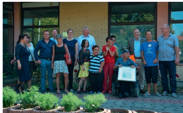
Der Bürgermeister mit einer Delegation aus Gradačac (Foto: Stadt Düren).