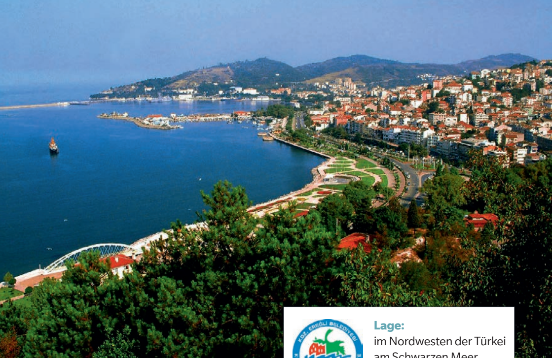
Blick auf Karadeniz Ereğli