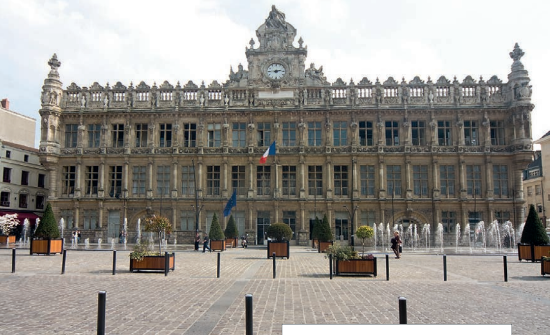
Das Rathaus der Stadt Valenciennes