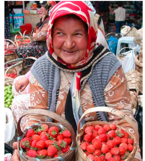
Oben: Eine Spezialität der Region: Frische Erdbeeren (Foto: Stadt Düren) Unten: Blick in den Hafen (Foto: Stadt Düren)

Karadeniz Ereğli, das als Herakleia Pontike bereits in der Antike bestand und als Megaras im 6. Jh. v. Chr. gegründet wurde, liegt in einer attraktiven Region der Türkei an der Schwarzmeerküste. Zahlreiche Sehenswürdigkeiten, wie das Archäologische Museum, das Museumsschiff Alemnda, die Cehennemagzi Höhle (Herkules) sowie die vier Kilometer lange Strandpromenade und unberührte Natur zeichnen diese Gegend aus. Im Juli findet hier alljährlich das beliebte Erdbeerenfest, ein internationales Kultur- und Gesangsfestival, statt. Die größte Eisen- und Stahlfabrik in der Türkei und eine große, international bekannte Schiffswerft geben vielen Menschen, auch aus dem Umland, ihr Auskommen.