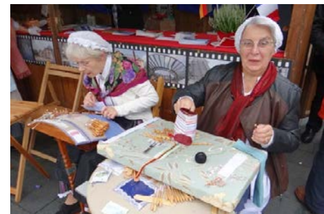
Traditionelles Handwerk in Valenciennes: Spitzenklöpplerin bei der Arbeit