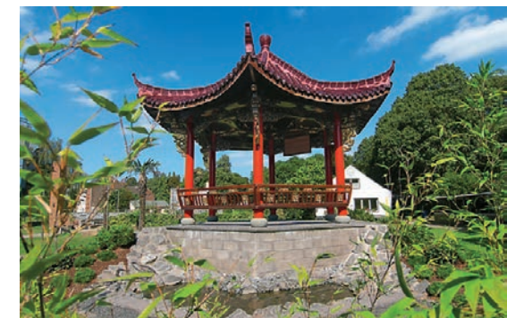
Geschenk an die Stadt Düren von der Partnerstadt Jinhua zum 10jährigen Bestehen der Städtepartnerschaft

Die landschaftliche Umgebung von Jinhua ist für ihre Schönheit berühmt und reich an historischen Sehenswürdigkeiten. Bekannte Ausflugsziele und touristische Attraktionen sind zum Beispiel die Shuanglong-Tropfsteinhöhlen, die bizarren Felsen von Yongkang, die Sechs-Höhlen-Berge von Lanxi oder die heißen Quellen von Wuyi. Es befinden sich viele historische Ortschaften im Stadtbezirk, die nach und nach restauriert werden.