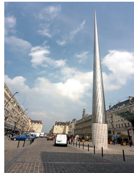
„Le Beffroi“ — „Der Wachturm“, das Wahrzeichen Valenciennes im Zentrum der Stadt