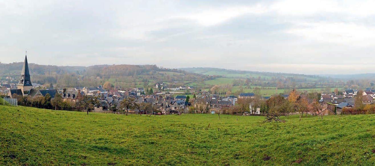
Panorama der Stadt Cormeilles