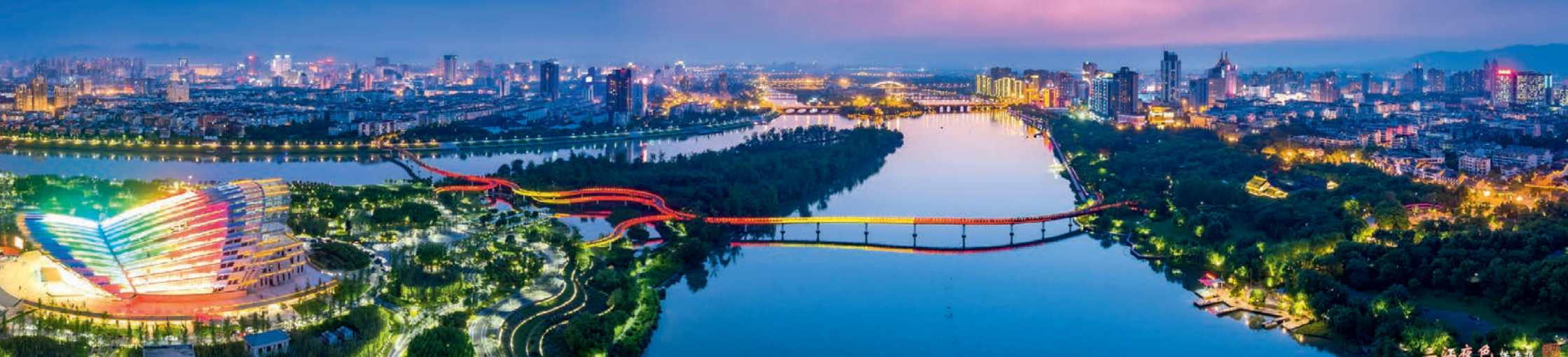
Skyline von Jinhua