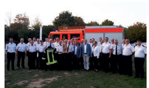
Feuerwehrgruppe Altmünster

Mit der Salzkammergut-Sommercard, die Urlauber von Mai bis Oktober im Tourismusbüro Altmünster gratis bekommen, erhält man bis zu 30 % Ermäßigungen auf die Sehenswürdigkeiten des Salzkammergutes.