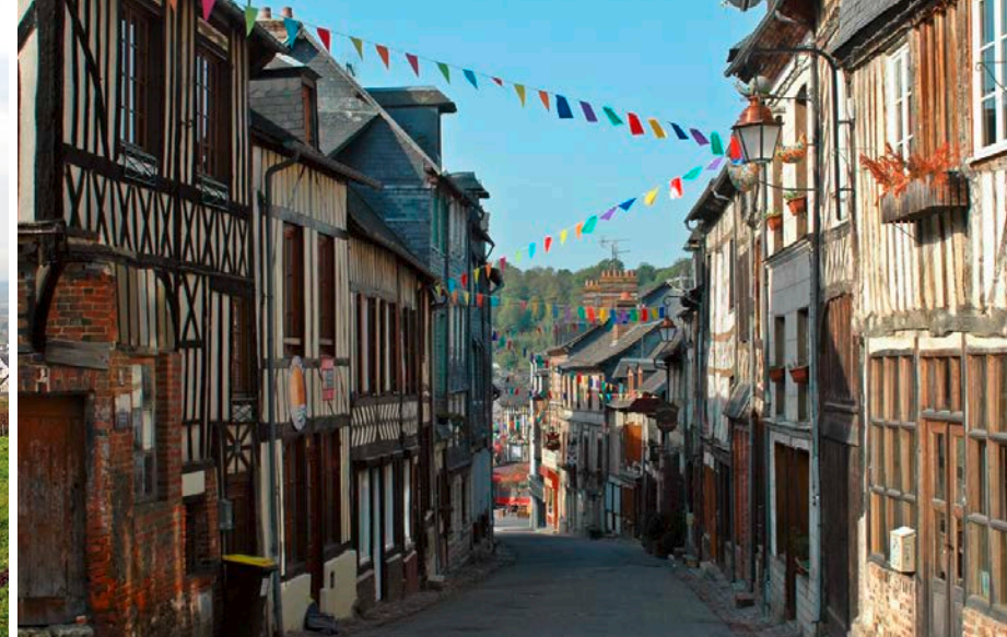
Blick in die Gassen von Cormeilles