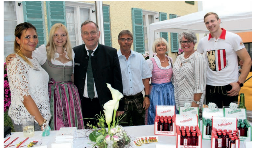
Erstmals präsentiert sich die Stadt Düren im August 2017 auf dem Marktfest ihrer Partnergemeinde.

Die Partnerschaft verdankt ihre Vitalität dem Engagement vieler Menschen. Die Begegnungen zeichnen sich seit 48 Jahren durch eine herzliche Atmosphäre und Sympathie aus. In den letzten Jahren gab es unter anderem einen Austausch zwischen dem Altenwohnheim in Altmünster und dem Schenkel-Schoeller-Stift