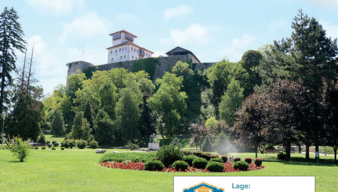
Burg Kula - Wahrzeichen der Stadt