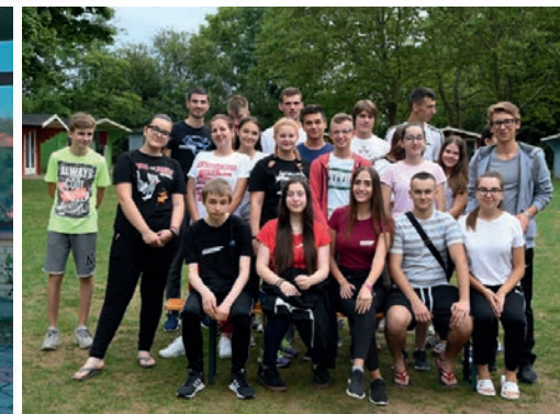
Jugendcamp Düren Gradačac