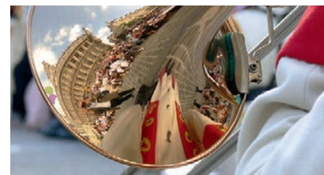
Das Rathaus von Valenciennes aus einem besonderen Blickwinkel beim traditionellen Musikzug in Valenciennes am ersten Septemberwochenende (Foto: Stadt Düren).