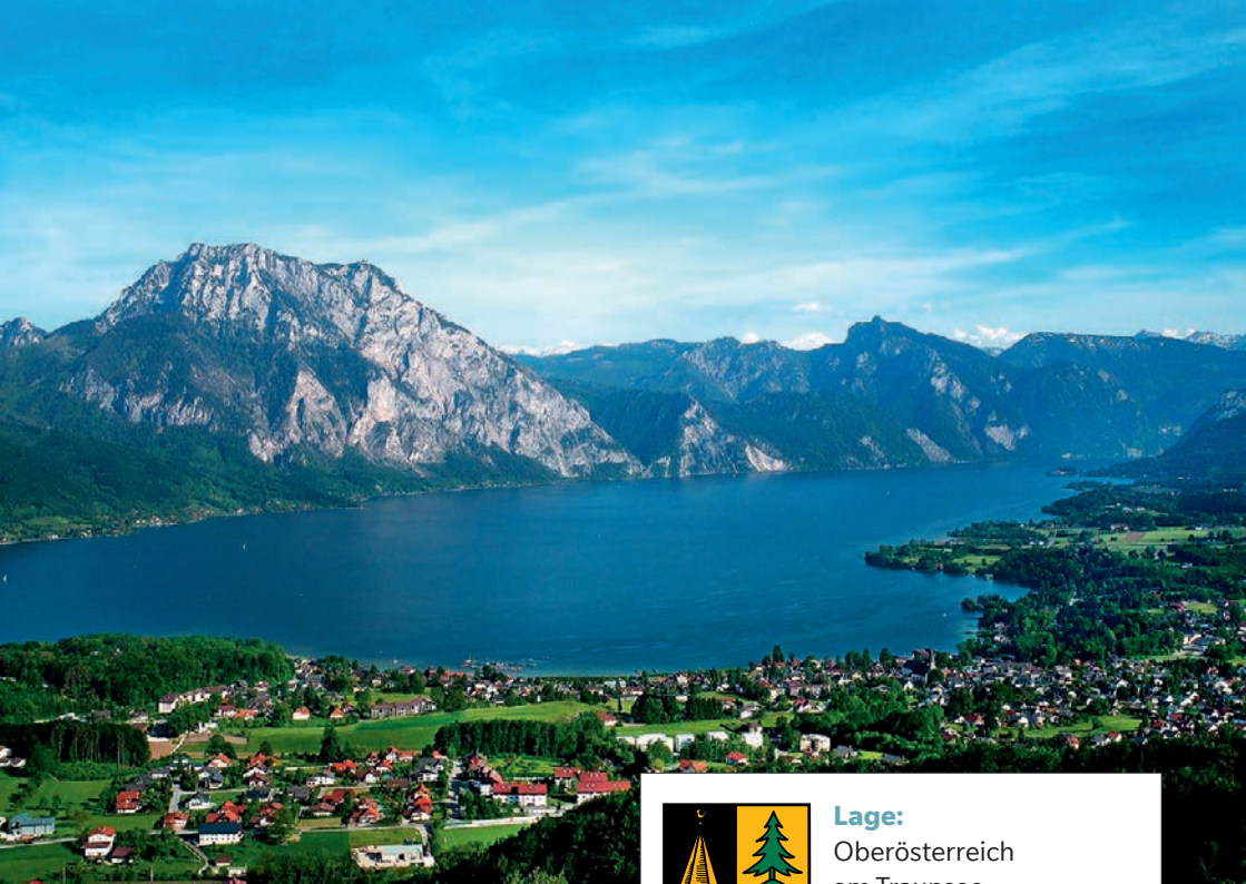
Panoramablick Altmünster