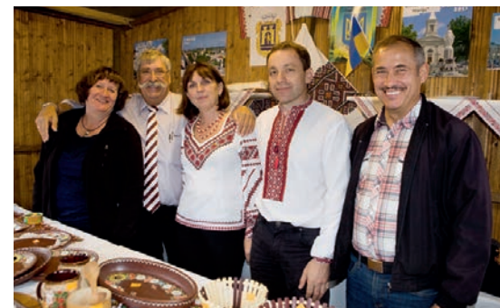
Eine Delegation aus Stryj zu Besuch auf dem Dürener Stadtfest (Foto: Stadt Düren).

Stryj wurde im Jahr 1385 gegründet, bekam 1431 Stadtrechte und war im 15. und 16. Jahrhundert eine blühende Handelsstadt. 1772 wurde sie österreichisch, 1939 war sie polnisch und fiel dann im Zuge der sowjetischen Besetzung Ostpolens an die Sowjetunion. Mit der Wende in Europa schlug 1990 die Geburtsstunde der unabhängigen Ukraine.