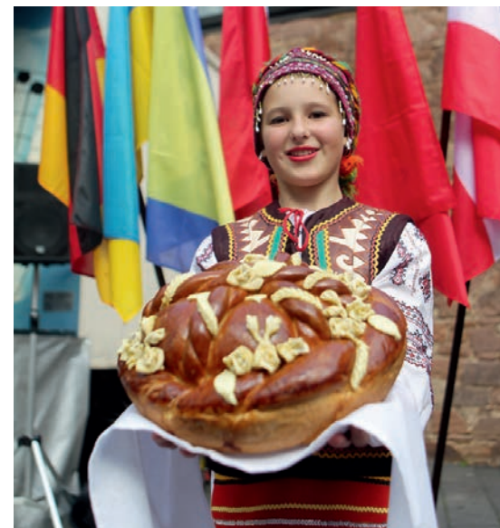
Ukrainische Folkloretänzerin übergibt das traditionelle Gastgeschenk – Brot mit Salzteig.